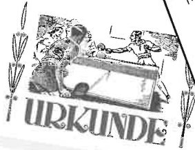
Aufsteiger 1. Kreisliga Main-Spessart Herren II