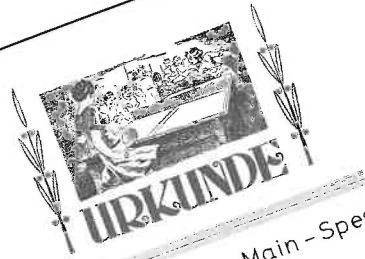
Meister 1. Kreisliga Main-Spessart Damen I